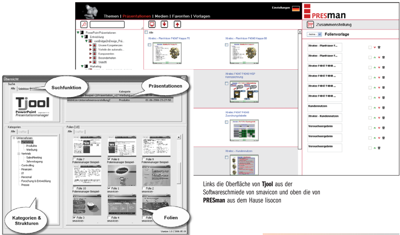
Links die Oberfläche von Tjool aus der Softwareschmiede von smavicon und oben die von PRESman aus dem Hause lisocon